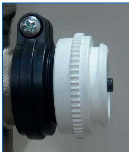
Bild 5 | Kupplungsring handfest aufschrauben (ohne zusätzliches Werkzeug).